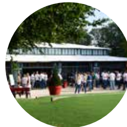
Salle du Pavillon