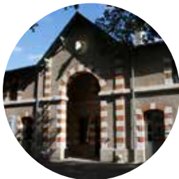
Salle du Cheval