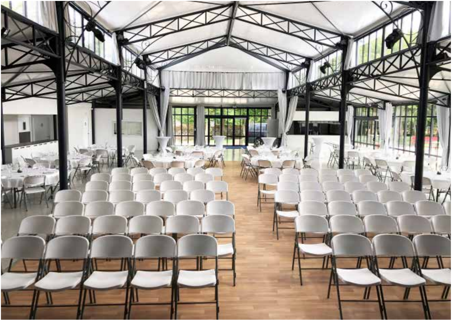
Salle du Pavillon