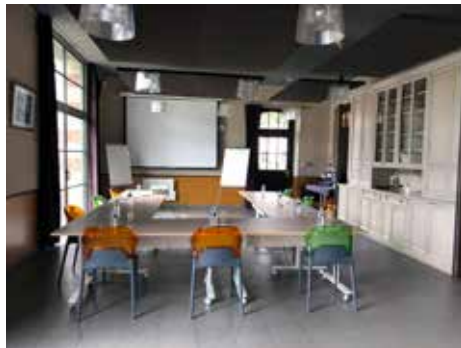
Salle de l'Étrier