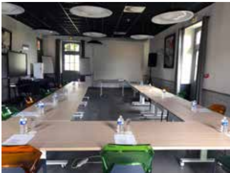
Salle du Cheval