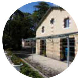
Salle de l'Étrier