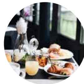
Buffet varié pour le petit-déjeuner

Une vue dégagée pour profiter d'un panorama unique sur le parc, en dépendance ou au château.